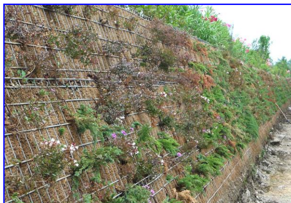
Foto 4 - Impiego del sistema preassemblato FAST-TER® nella realizzazione di una barriera visiva e fonoassorbente