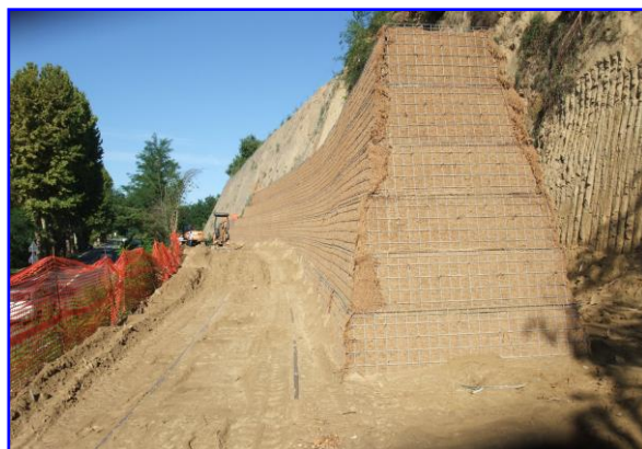
Foto 3 - Impiego del sistema preassemblato FAST-TER® nella realizzazione di un rilevato paramassi ad alto angolo (80°)