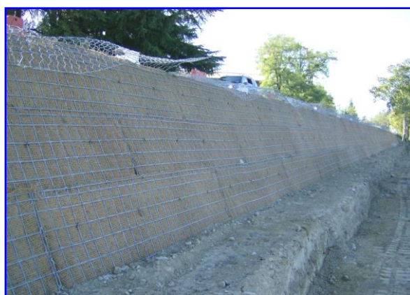
Foto 2 - Impiego del sistema preassemblato FAST-TER® nella realizzazione di un allargamento stradale di sottoscarpa