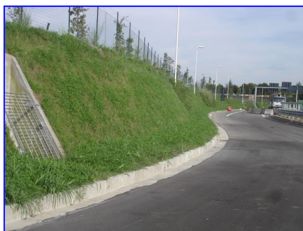
Foto 5 - Realizzazione di uno svincolo di uscita presso la tangenziale sud di Parma con Sistema FAST-TER®