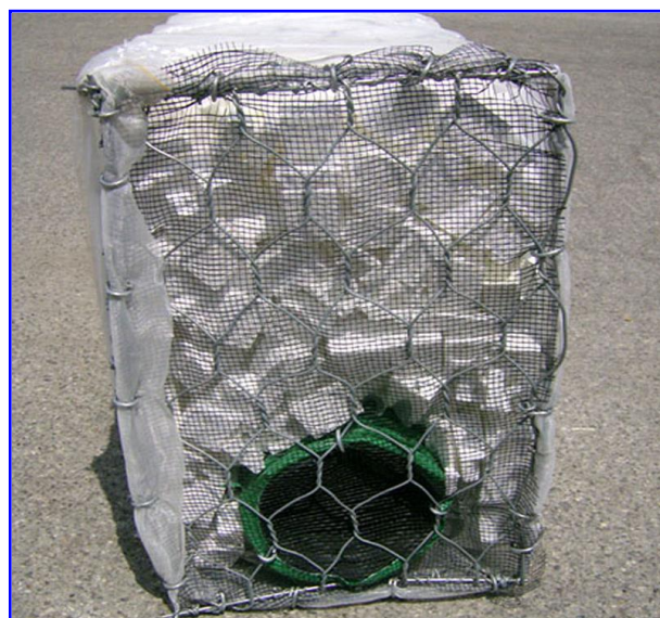
Foto 2 - Gabbiodren®T dimensioni 200x50x30, ideale per la bonifica agraria e per il controllo del livello di falda nei vigneti