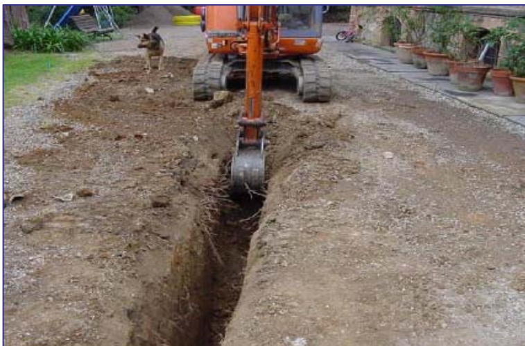
▲ Realizzazione dello scavo per l'alloggiamento della trincea Gabbiodren™