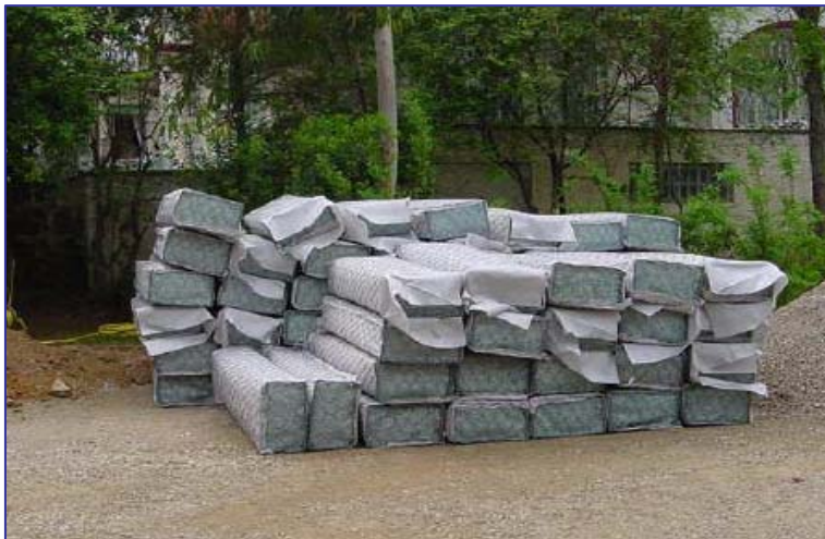
▲ Area di stoccaggio materiali del cantiere. Si notino la pulizia e ordine del cantiere necessarie in zone residenziali e di pregio