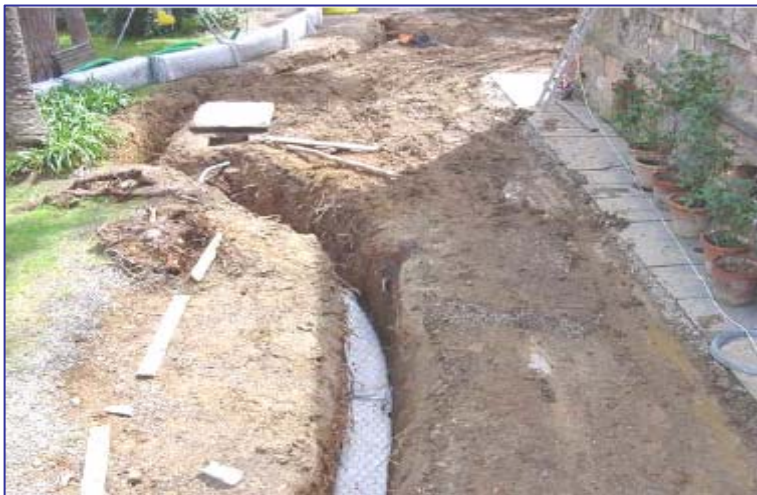
▲ Posa dei pannelli della trincea